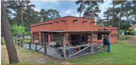
5-DAAGSE SAFARI LODGE/MINIBUS